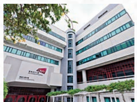
▲城市大學理學院明年將開辦三個全新理學士課程，以滿足市場新需要

而城大理學院明年與英國愛丁堡大學及曼徹斯特大學合作開辦的學位課程，理學士（計算數學）的學生可選擇報讀愛丁堡大學，而理學士（化學）的學生則可選擇曼徹斯特大學，共設20個學額。學生先在城大修讀首兩年課程，然後到海外大學完成餘下兩年的課程，完成學位要求後將獲頒兩個學位，分別由城大及海外大學頒發。