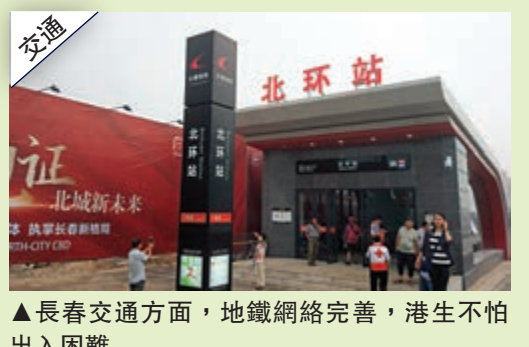
▲長春交通方面，地鐵網絡完善，港生不怕出入困難