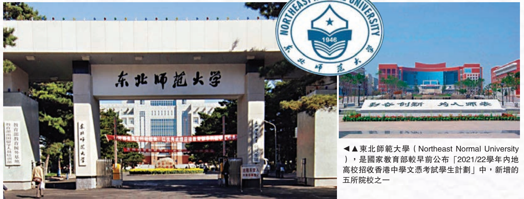
▲▲東北師範大學 (Northeast Normal University)，是國家教育部較早前公布「2021/22學年內地高校招收香港中學文憑考試學生計劃」中，新增的五所院校之一

該校課程備受認可，尤其是教育專業，國內教育系統不時需要引進高層次人才，如上月2021甘肅白銀會寧縣教育系統高層次和急需