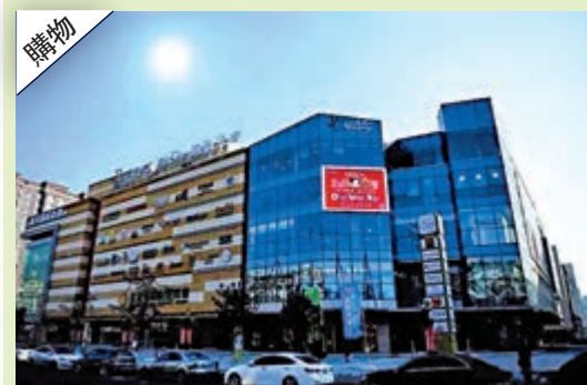
▲▲大學附近有不少商圍，桂林路小商圍及重慶路商圍，都可滿足同學的需要