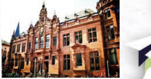
▲近年因為價錢及學科選擇等因素，多了本港學生選擇到歐洲升學。圖為海德堡大學

好處三：可留在當地發展 在全球化的環境下，年輕人都希望在自己的出生地以外嘗試謀求新發展，歐洲國家的國際學生於大學畢業後，一般容許留在當地一年至半年找工作，獲聘後可轉為工作簽證，長遠有機會申請永久居民身份，為自己的人生增添多一個選擇。