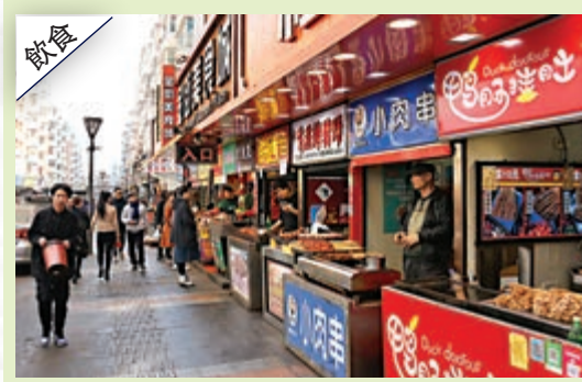
▲▲大學附近有不少商圍，桂林路小商圍及重慶路商圍，都可滿足同學的需要