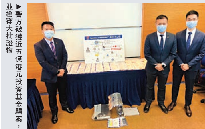
警方破獲近五億元港元投資基金騙案，並檢獲大批證物。

可換股票據，然後利用這些股票單據，透過自己及親人操作，換取基金名下的資產。當基金清盤後，基金名下經已沒有資產，令受害人蒙受損失。