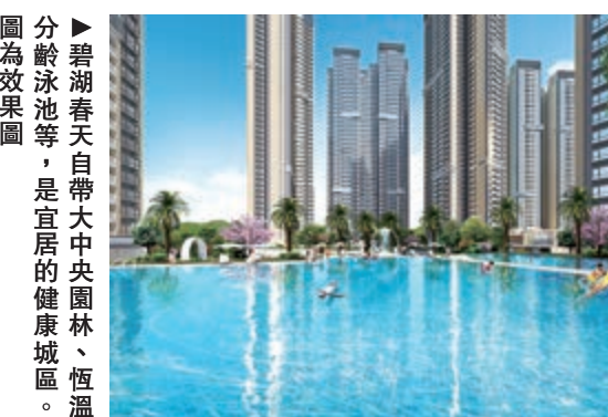
▲碧湖春天自帶大中央園林、恆溫分齡泳池等，是宜居的健康城區。