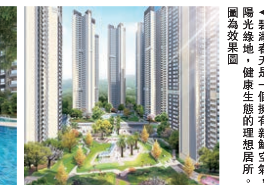
▲碧湖春天是一個擁有新鮮空氣，陽光綠地，健康生態的理想居所。