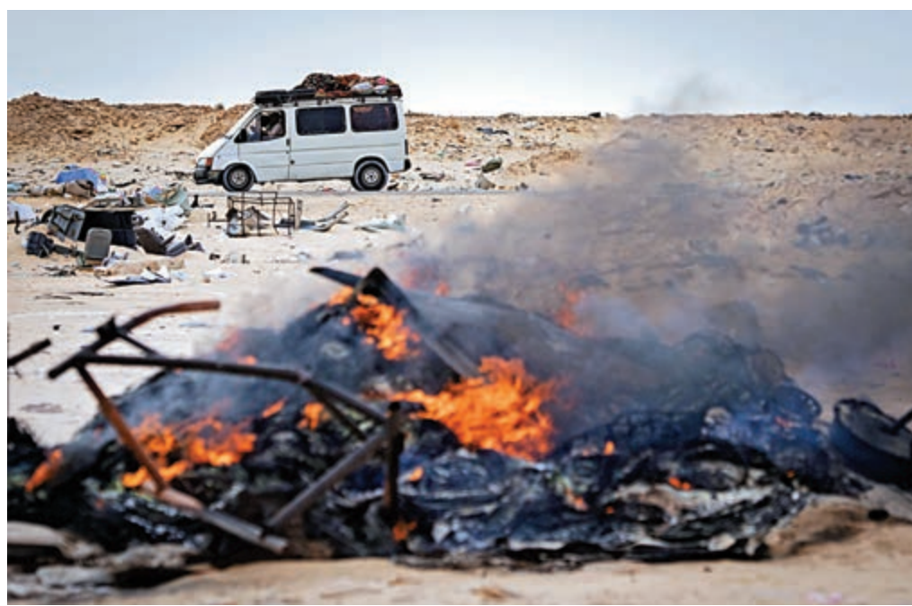
▲摩洛哥和「西撒哈拉人民解放陣線」上月在西撒哈拉地區重燃戰火

【大公報訊】綜合美聯社、CNN、Politico網站報道：美國政府10日宣布，摩洛哥與以色列已同意建立全面外交關係。摩洛哥是繼阿聯酋、巴林和蘇丹之後，第四個在特朗普政府撮合下與以色列實現關係正常化的阿拉伯國家。作為協議的一部分，美國同時宣布承認摩洛哥對西撒哈拉的主權。美國的這一表態與聯合國有意通過在當地舉辦全民公投來解決領土爭議的努力背道而馳。