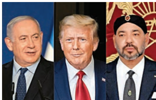
▲以色列總理內塔尼亞胡（左）、美國總統特朗普（中）、摩洛哥國王穆罕默德六世（右）

對於美方態度的突然轉變，聯合國秘書長古特雷斯的發言人杜賈里克第一時間強調，聯合國在西撒哈拉問題上的立場沒有改變。「這個問題的解決方案仍然能從安理會決議找到」。西撒哈