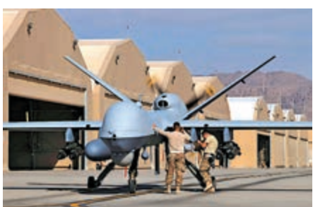
▲約三分之二到四分之三的CIA無人機由空軍借出

地的使用也將被限制。時任防長馬蒂斯2018年初發布《國防戰略》報告，美國國防戰略要向大國競爭轉變，而反恐不再成為重點。