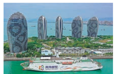
▲12月8日，2020年西沙郵輪航線復航啓動儀式在海南三亞舉行

海南省台辦主任劉耿表示，台商台企對參與海南自貿港建設態度積極，今年1至9月，海南新增台資企業43家，同比增長115%。