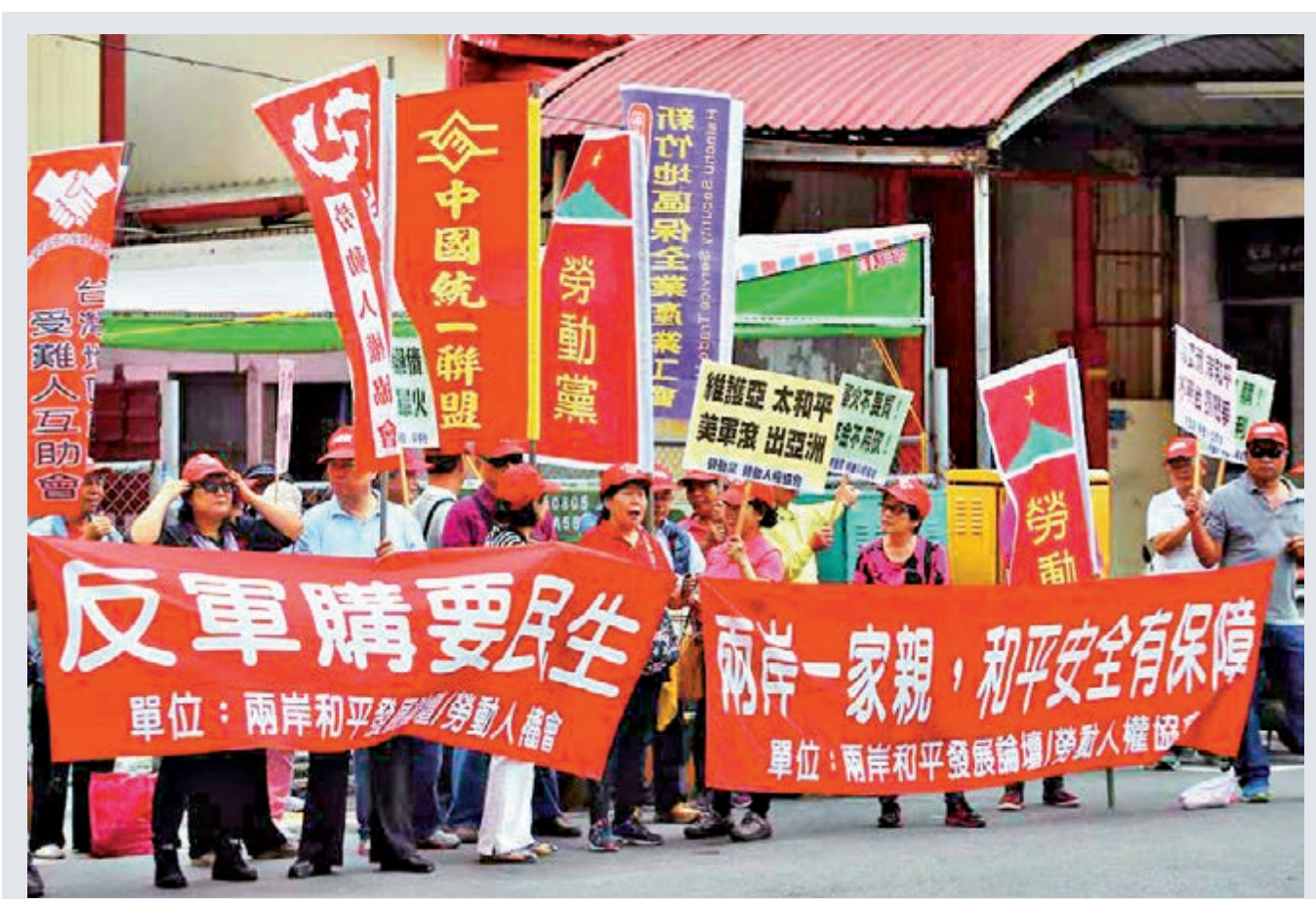
▲11日，美參議院通過國防授權法，鼓吹助台維持防衛能力。圖為台灣民眾走上街頭抗議美國對台軍售，禍害台海安全