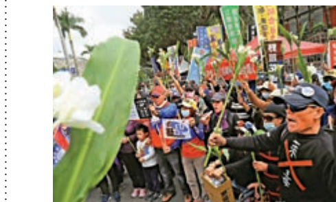
▲12日，台灣民眾集會抗議民進黨當局罔顧民生，開放含瘦肉精美豬入境

台灣「行政院長」蘇貞昌12月11日面對立委質詢時承認，軍購預算確實對當局財政造成巨大壓力。