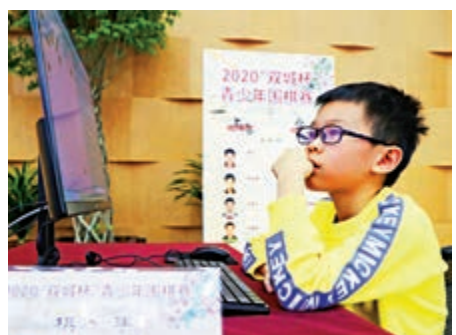
▲12日，2020「雙城杯」青少年圍棋賽以線上連線的方式在上海、台北兩市開賽 中新社

【大公報訊】據中新社報導：2020「雙城杯」青少年圍棋賽12日在上海、台北兩市開賽，在新冠肺炎疫情的特殊背景下，兩岸青少年通過線上連線的方式，同下一盤棋，搭建雙城體育交流新平台。