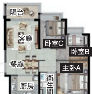
翡翠華庭86平米3室2廳戶型平面圖

率35%，裝修交付。總戶數達到1687戶，樓盤將是集住宅、商業中心、寫字樓、學校（幼兒園、小學）、交通樞紐、生態休閒活動等多種業態於一體的住宅社區，未來還將開通樓巴連接廣州北站。