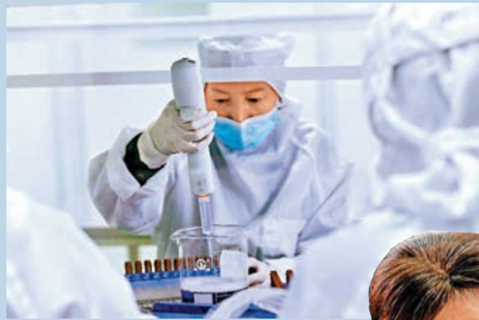
▲在復星醫藥位於上海寶山的長征醫學研發生產廠區，工作人員對新冠肺炎核酸檢測試劑進行分裝