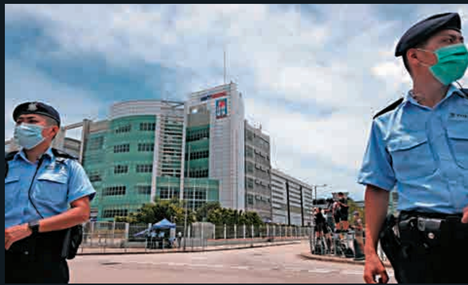
▲今年8月，警方進入壹傳媒大樓搜查相關證物