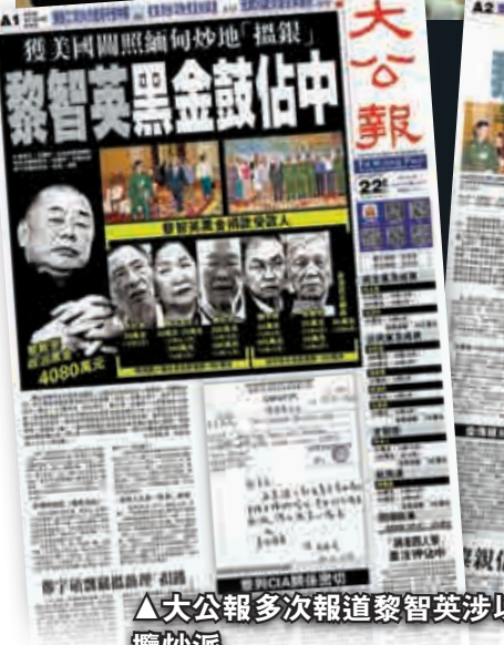
▲大公報多次報導黎智英涉以「政治獻金」資助攬炒派