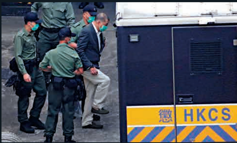
▲黎智英身負多宗控罪，早前被鎖上鐵鏈及手銬，押解到西九龍法院提堂