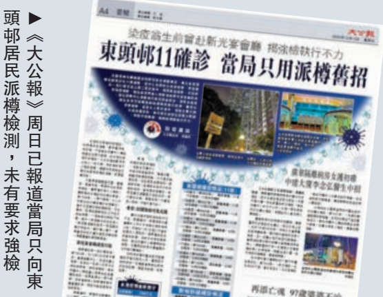
▶《大公報》周日已報道當局只向東頭邨居民派樽檢測，未有要求強檢