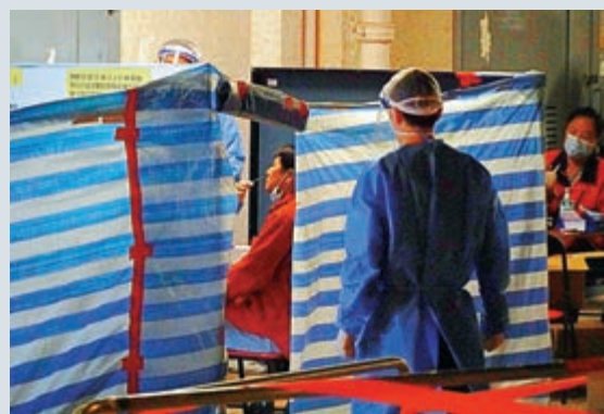
▲當局在貴東樓門口設置由圍板及帆布搭起的臨時檢測站，安排住戶逐批落樓接受強制檢測