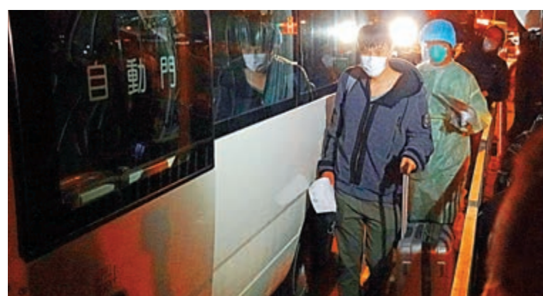
◀居民拖行李上專車，被送往檢疫中心隔離