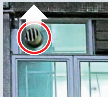
▲貴東樓多個15室單位有人確診，懷疑病毒經抽氣扇傳播