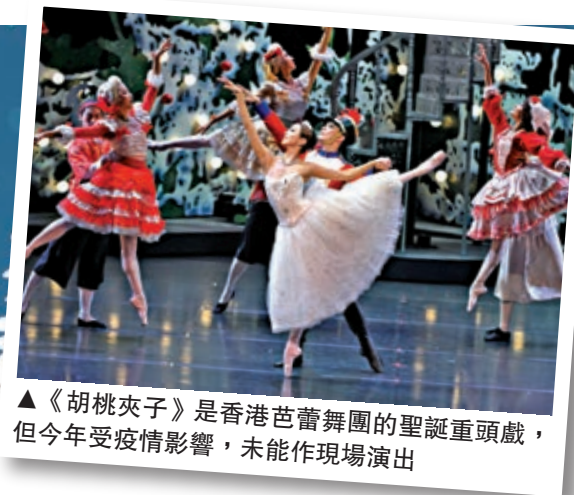
▲《胡桃夾子》是香港芭蕾舞團的聖誕重頭戲，但今年受疫情影響，未能作現場演出