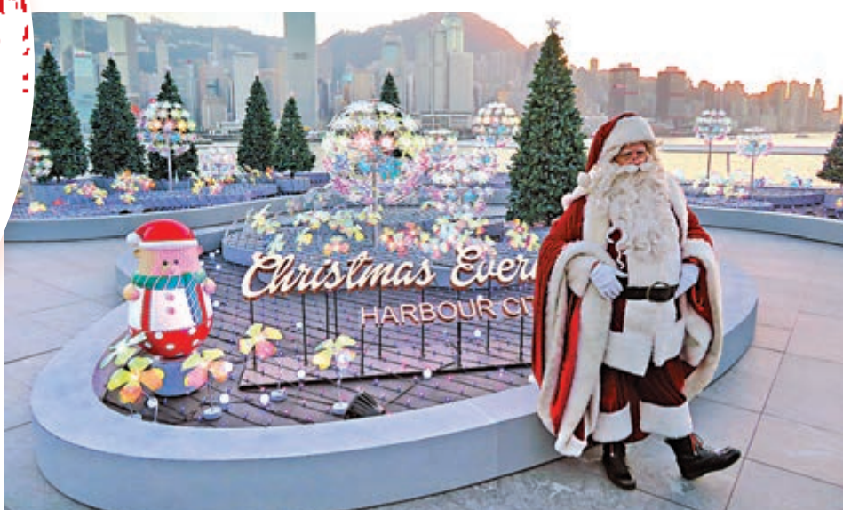
▲海港城在戶外平台打造「聖誕燈飾花園」，遊客在晚上6時後參觀，需提前在網上預約