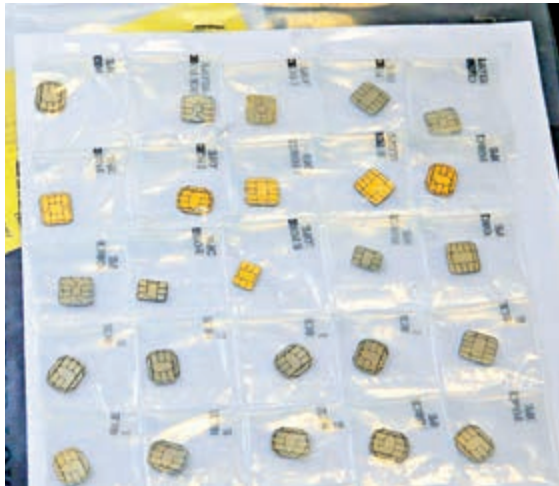
▲警方在行動中檢獲一批信用卡晶片

「盜竊」和「偽造」罪屬嚴重罪行，根據香港法例第210章《盜竊罪條例》一經定罪，最高可被監禁10年，而根據香港法例第200章《刑事罪行條例》的「偽造」罪，一經定罪，同樣可被監禁10年。