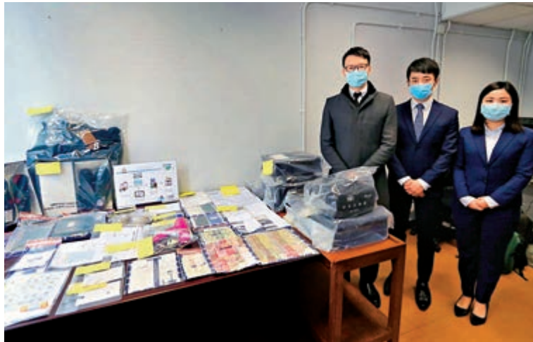
▲警方表示，案件涉款32萬，行動中拘捕一名涉案男子，並檢獲大批證物