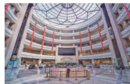
▲專家指出，中國雖然堅持安全導向，但並不是封閉。圖為浙江自貿試驗區綜合服務大廳 資料圖片