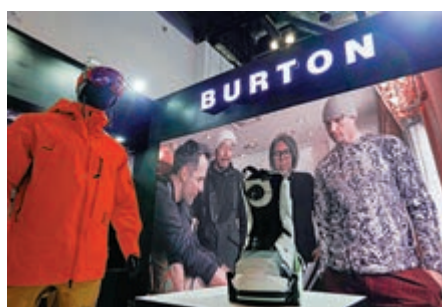
▲王毅希望美方向中方相向而行。圖為服貿會的美國公司展台 資料圖片

【大公報訊】據新華社報道：國務委員兼外長王毅18日晚在北京同美國亞洲協會舉行視頻交流。王毅表示，即將過去的2020年，由於美方在一系列問題上干涉中國內政