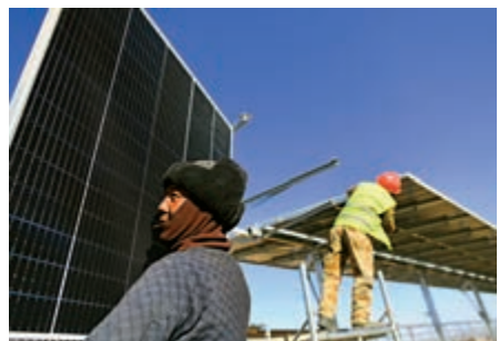
▲《安審辦法》適用於關係國家安全的重要能源和資源等領域

《安審辦法》第四條並明確下列範圍內的外商投資，外國投資者或者境內相關當事人應當在實施投資前主動向工作機制辦公室申報：一是投資軍工、軍工配套等關係國防安全的領域，以及在軍事設施和軍工設施周邊地域投資；二是投資關係國家安全的重要農產品、重要能源和資源、重大裝備製造、重要基礎設施、重要運輸服務、重要文化產品與服務、重要信息技術和互聯網產品與服務、重要金融服務、關鍵技術以及其他重要領域，並取得所投資企業的實際