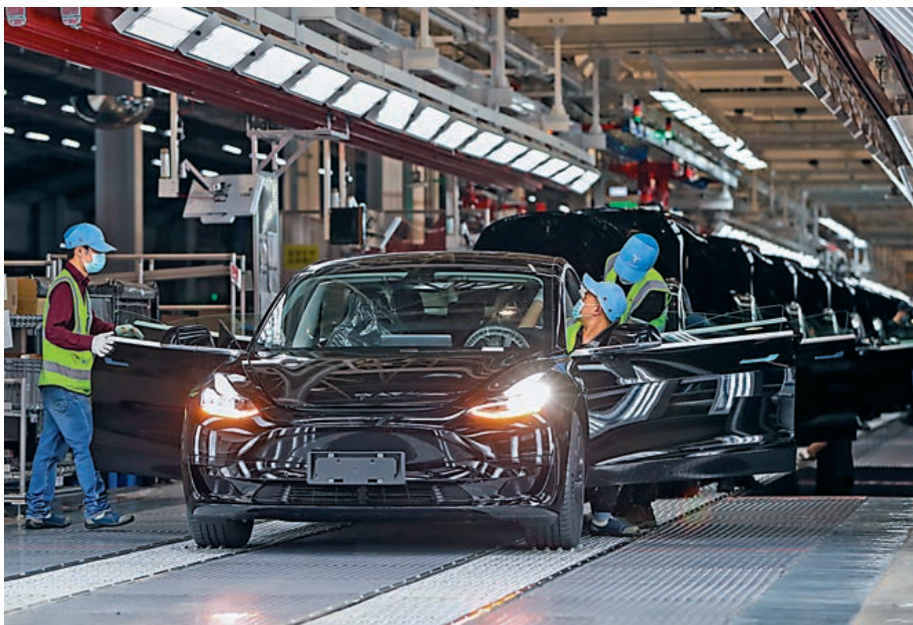
◀中方表示，出臺《安審辦法》不是搞保護主義、更不是開放倒退。圖為工作人員在特斯拉上海超級工廠內作業

外商投資安全審查工作機制辦公室有關負責人介紹，制定《安審辦法》的總體思路第一是統籌發展和安全。堅持開放和安全並重，把握好積極促進外商投資和維護國家安全的關係，建立與准入前國民待遇加負面清單管理制度相適應的外商投資安全審查制度，推動擴大開放與風險防控協同共進，有效管控影響或者可能影響國家安全的外商投資，堅決築牢國家安全屏障、防範化解國家安全風險，同時增強針對性，避免安全審查泛化。