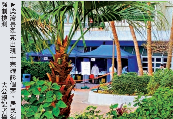
強檢屋苑大廈與確診者名單