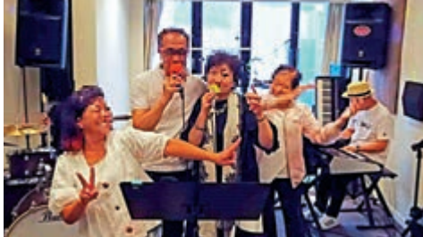
▲Billy Sir音樂教室新增兩宗確診，累計12人確診

另外，律敦治醫院一名護士在本月15日為一名97歲女病人進行家居探訪，該病人兩日後在東區醫院初步確診，護士被列為密切接觸者。醫管局總行政經理黃慧珍