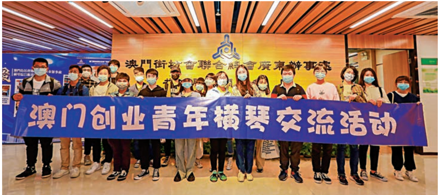
▲澳門創業青年在橫琴交流