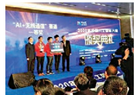
▲2020全國人工智能大賽決賽頒獎典禮在深圳舉行

用已經涵蓋了全國的4000多所校園和8萬多個銀行網點。未來，團隊還將探索更多技術落地場景，還可能繼續深化該算法在6G場景下的應用。