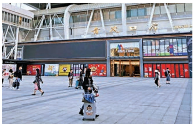
▲粵澳新通道青茂口岸主體工程基本完工，預計明年2月驗收及設備調試

青茂口岸項目相關負責人指出，該口岸正式啟用後，將推動澳門建設世界旅遊休閒中心，還將推動粵澳協同發展，促進粵港澳大灣區共建優質生活圈。