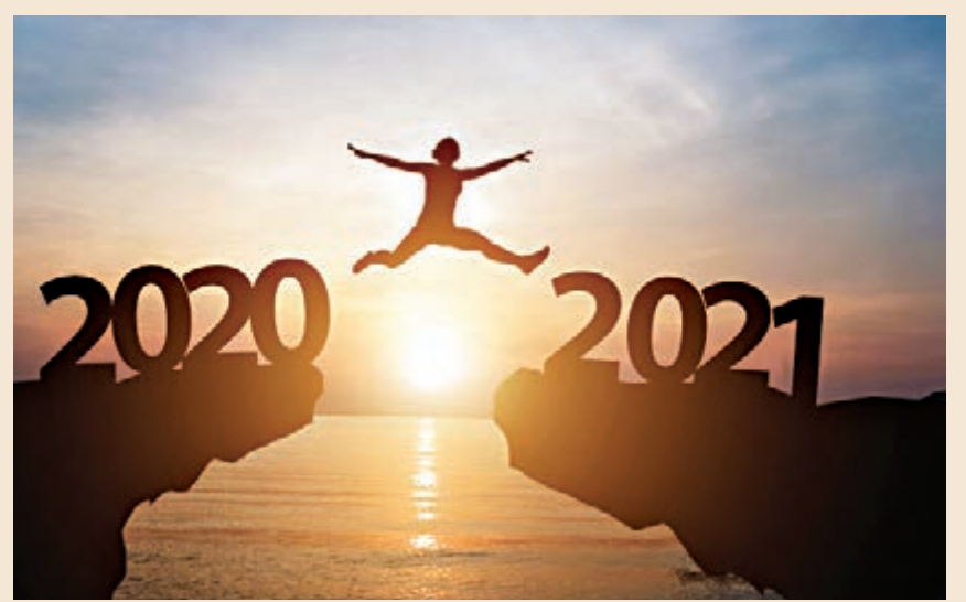
▲二〇二〇年即將過去 資料圖片

二〇二〇這一年，四季已滿，並不順遂。以驚惶始，以憂慮終。貫穿四季的，是看不到盡頭的「隔離」「限聚」「禁足」「確診病例數」，是從不習慣到不離不棄的「口罩」「消毒液」，是遙遙無期的親人相望不相見，是寸步難行又必須堅持的等候，是打破工作生活慣例的改變，是自律與自由的考驗與抉擇。我總覺得，自律是一個人是否靠譜的標誌之一。值得高興的，是自己的自律得到驗證，還不錯！值得珍惜的，是朋友同事的情誼。自大年