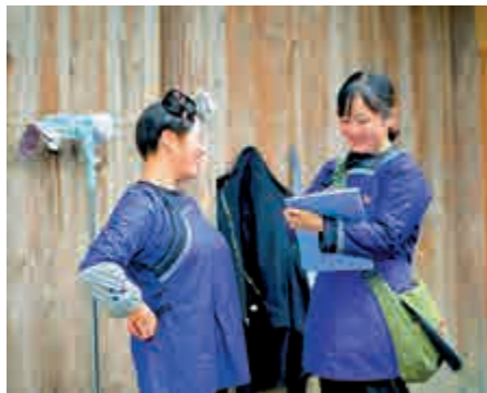
▲11月16日，貴州榕江縣平江鎮一位共產黨員（右）走訪結對幫扶戶

習近平強調，講政治必須提高政治執行力。領導幹部特別是高級幹部要經常同黨中央精神對表對標，切實做到黨中央提倡的堅決響應，黨中央決定的堅決執行，黨中央禁止的堅決不做，堅決維護黨中央權威和集中統一領導，做到不掉隊、不走偏，不折不扣抓好黨中央精神貫徹落實。要把堅持底線思維、堅持問題導向貫穿工作始終，做到見微知著、防患於未然。要強化責任意識，知責於心、擔責於身、履責於行，敢於直面問題，不迴避矛盾，不掩蓋問題，出了問題要敢於承擔責任。