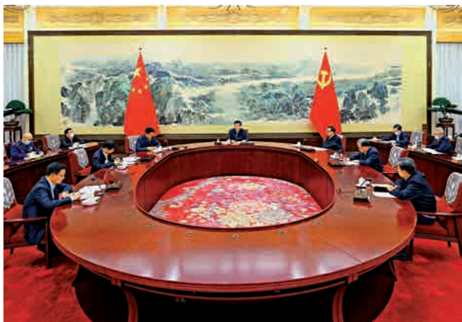
▲中共中央政治局24日至25日召開民主生活會

【大公報訊】中共中央政治局於12月24日至25日召開民主生活會，主題是認真學習習近平新時代中國特色社會主義思想，加強政治建設，提高政治能力，堅守人民情懷，奪取全面建成小康社會、實現第一個百年奮鬥目標的偉大勝利，開啟全面建設社會主義現代化國家新征程。中共中央總書記習近平主持會議並發表重要講話。習近平強調，必須增強政治意識，善於從政治上看問題，善於把握政治大局，不斷提高政治判斷力、政治領悟力、政治執行力。