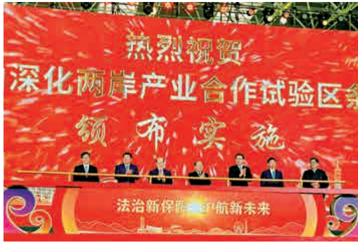
▲《昆山深化兩岸產業合作試驗區條例》25日在昆山頒布

【大公報訊】記者賀鵬飛昆山報道：昆台融合發展30周年座談會25日在江蘇省昆山市舉行，全面展示昆台融合發展30年來的實踐和成果。中共中央台辦、國務院台辦主任劉結一表示，大陸仍具有多方面優勢和條件，廣大台胞台企扎根大陸發展機遇巨大，空間廣闊。