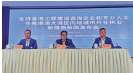
▲29日，廣東省住建廳介紹灣區內地城市開業執業新措施，並即場連線解答港業界疑難。

疫情雖然暫時阻隔了粵港兩地的距離，但隔離不了灣區各界渴望交流合作的心。29日，廣東舉行一場有關支持香港工程建設諮詢業界到大灣區開業執業的發布會。記者提前抵達會議現場，大屏幕上同時顯示了7個不同分會場的粵港參會者的笑臉。藉着調試設備的時間，他們互相打招呼，氣氛輕鬆。