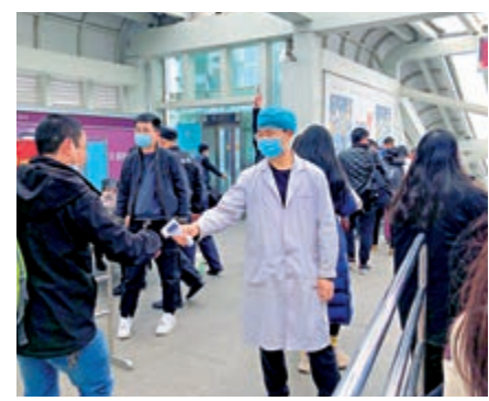
▲廣東在元旦春節期間堅持「外防輸入內防反彈」不放鬆，圖為高鐵路對旅客測溫。

【大公報訊】記者張帥、方俊明報道：國鐵集團12月29日介紹，2021年鐵路春運自1月28日開始，3月8日結束，共計40天。其間，全國鐵路預計發送旅客4.07億人次，日均發送旅客1018萬人次。大公報記者了解，為防控新冠