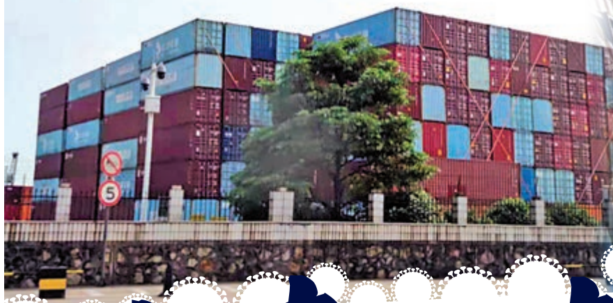
▼東莞港的集裝箱堆得密密麻麻。不少香港外資企業年底都忙搶訂貨櫃