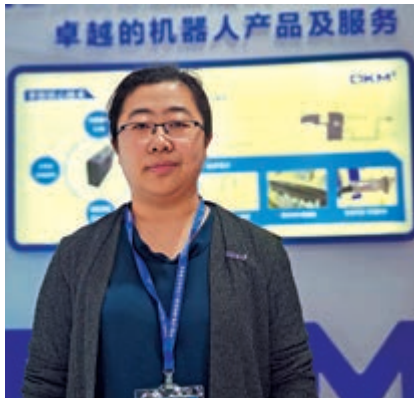
▲石金博表示，很多企業開始積極轉型自動化