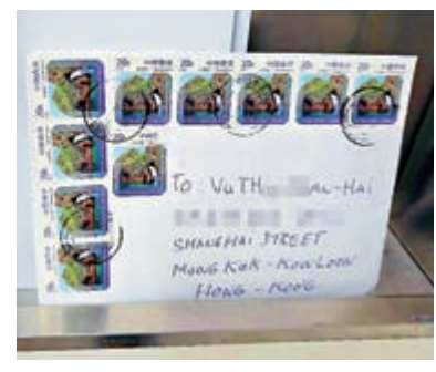
▲黃臨福居住的旺角唐樓劏房，家人已搬走，不過仍有一封寄到上址，收件人寫上越南拼音的信件