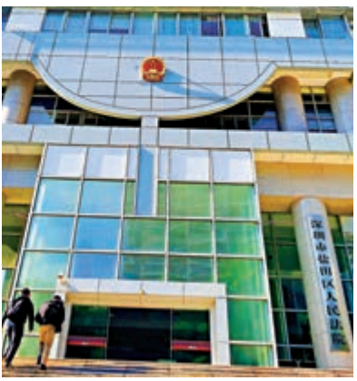
▲深圳市鹽田區人民法院對12名港人進行公開宣判