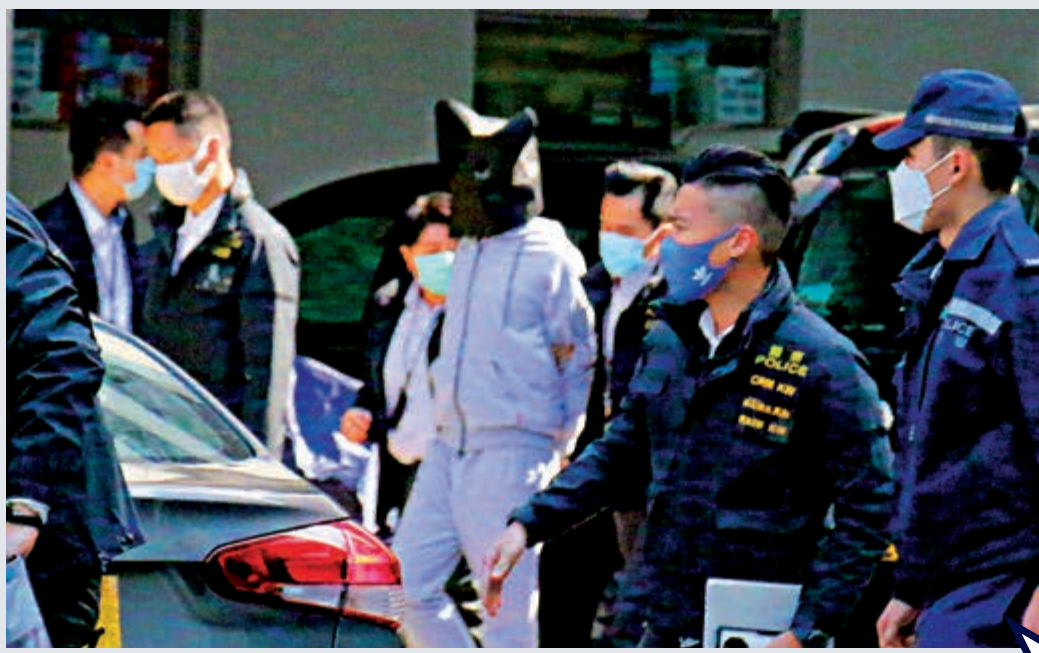
▲案中兩名犯案時未成年疑犯（左圖及右圖），由內地警方經深圳灣口岸移交香港警方，押往天水圍警署扣查