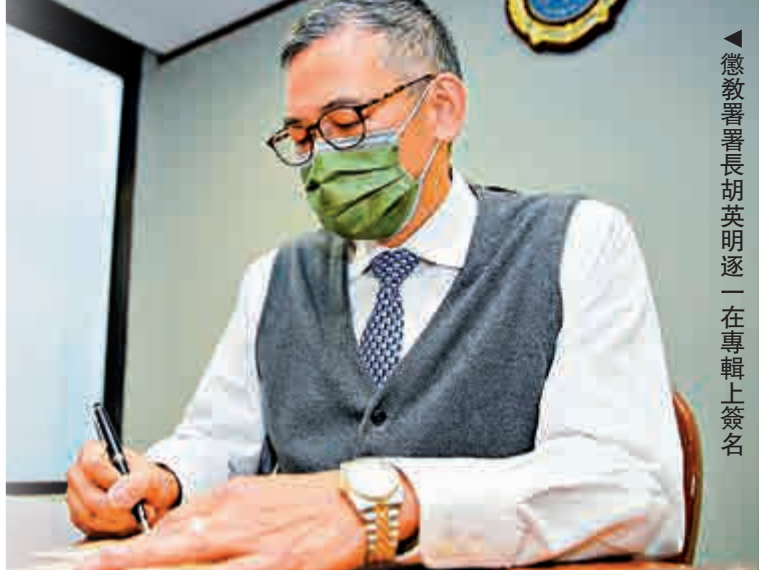
▲懲教署署長胡明遠一在專輯上簽名

由1920年獨立於警隊後，當時的監獄署開始專責管理全港監獄設施，至今已一百周年。作為送給懲教署成立一百周年的禮物，《歲月豪懲》專輯收錄了《歲月豪懲》、《同一使命》、《只因有您》、《懲繫我手》及《最後防線》五首歌曲。歌詞總結出懲教工作包括羈管、服務質素、更生事務及人力資源四大工作範疇。創作團隊更特意製作音樂視頻及音樂伴唱版本，讓大家可以視、聽、唱三種方式細味懲教工作，甚至同唱屬於懲教的歌。