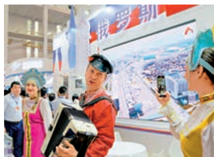
▲在去年舉辦的海絲之路文藝博覽會上，俄羅斯參展代表表演民族歌舞。資料圖片