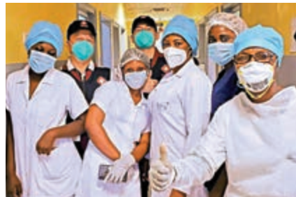
▲去年5月，中國抗疫醫療專家組在剛果（布）首都布拉柴維爾指導新冠肺炎病房建設。資料圖片