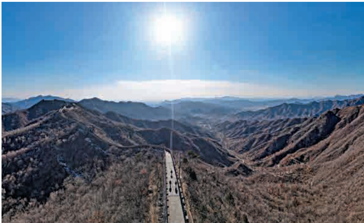
▲阿毛想將這幅照片命名為《長城之師》。