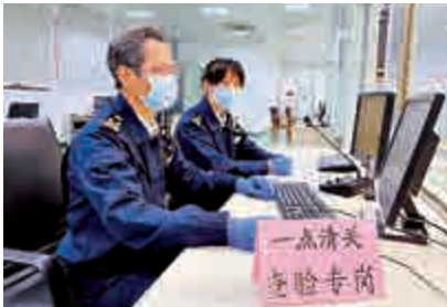
▲廣州口岸實施「一點清關」，提升港澳進境郵件通關速度。

「每年有數百萬件港澳郵件從廣州口岸進境。此前，郵件需要在運抵後進行信息補錄、申報，加上轉關運輸存在路線迂迴、時效慢等問題，企業的運營成本不低。」廣東省航空郵件處理中心有關負責人表示，開通穗港、穗澳進境郵件「一點清關」業務後，此類郵件可直接運到廣州，依託信息化監管模式快速辦結海關手續，投遞效率提升了20%。接下來，穗港澳海關及郵政等部門將加強區域合作，為粵港澳大灣區寄遞物流發展注入新活力。