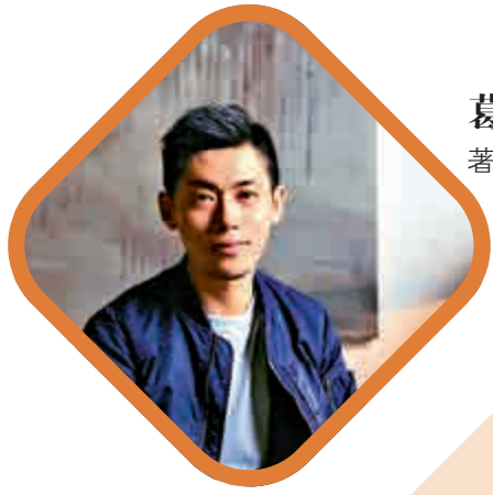
葛亮 著名作家，香港浸會大學文學院副教授