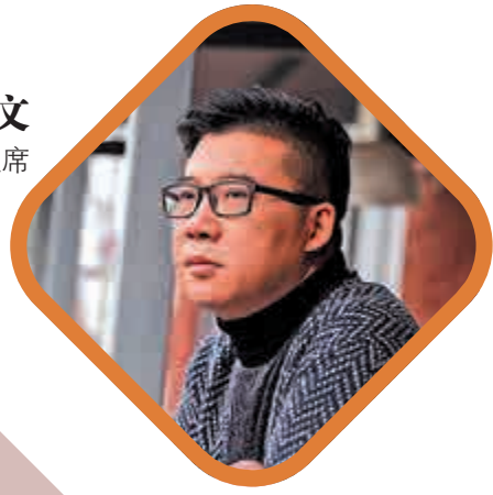
李修文 著名作家，湖北省作家協會主席