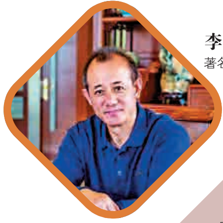
李輝 著名作家，學者，資深副刊編輯