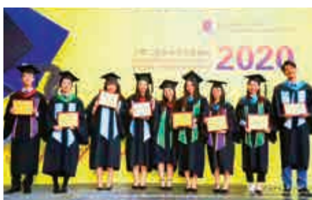
▲港中大（深圳）畢業生超過70%留在粵港澳大灣區就業。

量報告，2020屆本科畢業生共354人，直接就業141人，佔畢業生總人數的39.83%，平均年薪17.08萬元。根據統計，學生就業集中分布在深圳、上海、廣州、北京、杭州，就業單位中，航天國防單位就業人數佔24.11%，在世界500強企業就業人數佔31.21%，畢業生去向最多的用人單位是華為。