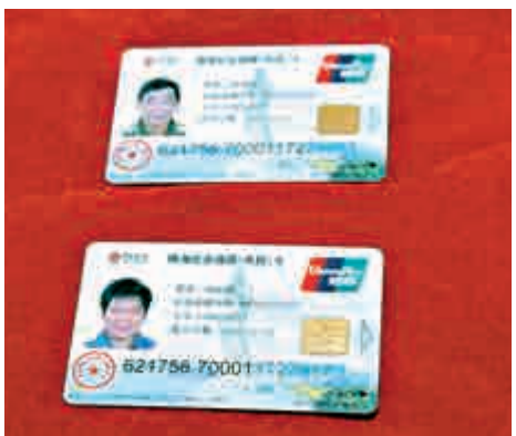
▲目前澳門居民在珠海參保人數超過2.4萬人，圖為澳門居民申辦的珠海社保卡。

直接申請養老金。同時，「珠海社保掌上辦」微信服務平台已上線。澳門居民只要關注「珠海社保」微信公眾號，完成實名註冊綁定，可辦理養老保險、醫療保險、社會保障卡等61項業務。