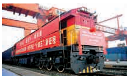
▲1月1日，中歐班列（成渝）號首列班車在重慶團結村站等待發車。

國鐵集團介紹，去年國家鐵路日均裝車達16.1萬車，創歷史最好水平。中歐班列開行數量逆勢增長，全年開行1.24萬列，發送113.5萬標箱，同比分別增長50%、56%。中歐班列年度開行數量首次突破1萬列。