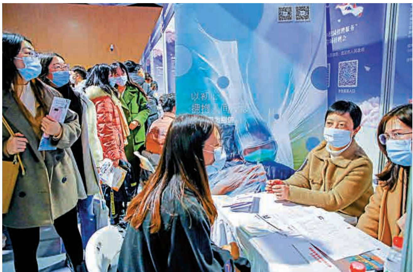
▲廣東作為內地經濟強省，就業崗位多、薪酬待遇高，不少名校畢業生月薪達到一萬元人民幣以上。圖為招聘會上大學生與企業招聘人員進行交流。

此前，香港浸會大學工商管理學院人力資源策略及發展研究中心調查指出，2020年香港學士畢業生的平均月薪約為1.4萬港元至1.6萬港元。