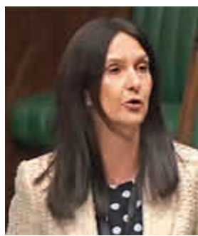
蘇格蘭議員費里爾去年9月28日染疫時在倫敦下議院發表演講。

事件引爆英國輿論，費里爾迅速被蘇格蘭民族黨停職。蘇格蘭首席大臣施雅雅等人士敦促她辭去議員職務。費里爾稱感到深深後悔，為自己的錯誤行為向公眾道歉。