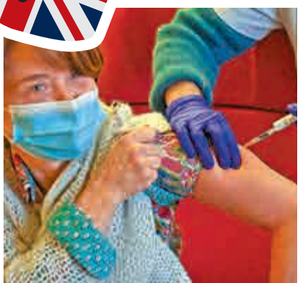
一名法國護士4日接種輝瑞疫苗。