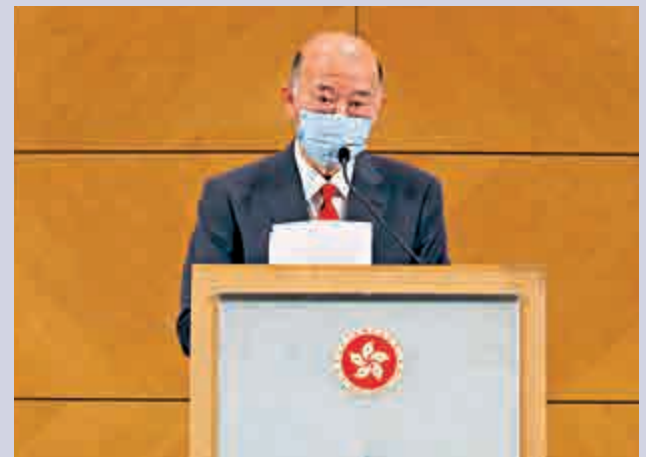
馬道立將於下周一正式退休，他表示，任內的使命是要維持香港的法治。