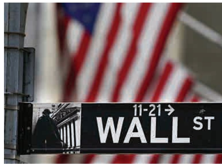
▲美聯儲局堅持直至明年年底前不加息，但美債息上升則代表企業融資成本加重，美國經濟復甦更加凍過水。

十年期美國國債孳息率日前還處於0.92厘水平，就在國會確認拜登勝選前夕，美國國債湧現大量沽盤，推升了十年期國債孳息，昨晚更一度上1.028厘，為去年3月以來最高，跌勢頗為急勁，預示美債市況有牛轉熊之