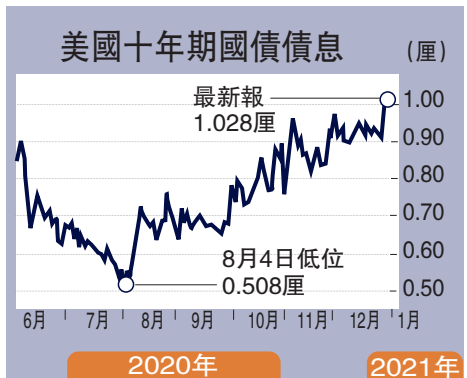
美國十年期國債孳息 (厘)