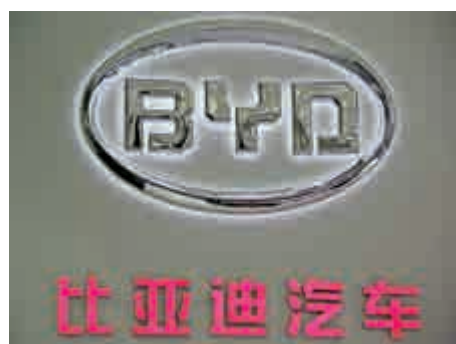
▲比亞迪去年11月份銷售汽車約5.39萬輛，按年增長30.6%。

至於旗下比亞迪半導體，乃中國最大絕緣柵雙極型電晶體(IGBT)廠商，已成功引入紅杉資本中國基金、中金資本、國投創新等知名投資機構，今年將落實分拆上市。