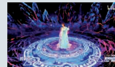
◀歌手黃雅莉站在「五靈法陣」中演唱仙劍主題曲《殺破狼》。

●到了80、90後的集體回憶《仙劍奇俠傳》組曲部分，舞台背景一會兒是仙劍客棧的模樣；一會兒又變成了遊戲中鎖妖塔的布景，歌手黃雅莉一身古裝站在「五靈法陣」中，演唱電視劇《仙劍奇俠傳》主題曲《殺破狼》。鎖妖劍懸浮於身後，一時間彈幕上全是「爺青回」（爺的青春又回來了）的感嘆。