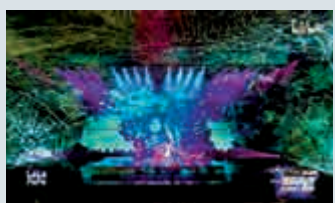
►《西遊·問心》節目中，舞台變成一個巨大的「盤絲洞」。

●絢爛的霓虹燈光和未來風格的舞台美術，再配上電子音樂，一個賽博朋克城市降臨舞台。動漫、遊戲、影視在悠長的歲月中陪伴了幾代人的成長，B站2021跨年晚會在復刻經典IP時，用科技感十足的舞台效果還原影視、遊戲中的經典場景，於炫目的電光火石中，用舞台效果烘托演員演繹，融科技於情懷。舞蹈《西遊·問心》中，演至「盤絲洞」一幕時，舞台布景上赫然出現了用光影「編織」的蜘蛛網，令整個舞台變成一個巨大的「盤絲洞」，中間呈現雲層效果，炫目的燈光隨主題曲層層推進和變化，效果之奇幻可謂震撼。