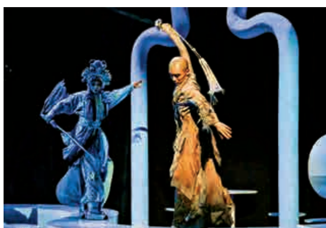
◀《驚·鴻》融合六種傳統節目。

不僅如此，傳統中國樂器也能奏響流行音樂，今次格萊美音樂家吳彤選用中國民族樂器笙吹奏《貓和老鼠》、《JOJO的奇妙歷險》等經典動畫音樂，高亢的嗩吶聲配合湯姆貓經典動作，很有動感，繼而引領觀眾思考傳統與流行、東西文化的碰撞，究竟是怎麼一回事。也在演繹的過程中，尋找到了傳統樂器在現代社會的更多可能性，它們不僅可以演奏經典民樂，更能演奏一系列「潮樂」。