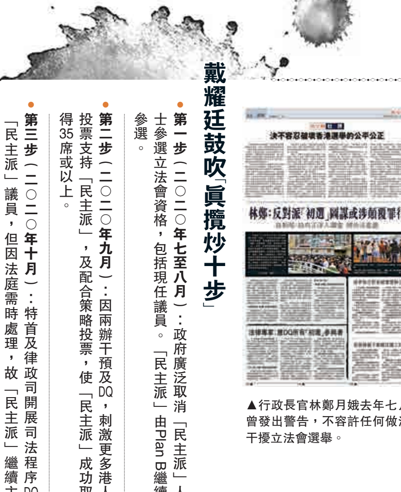
▲行政長官林鄭月娥去年七月曾發出警告，不容許任何做法干擾立法會選舉。