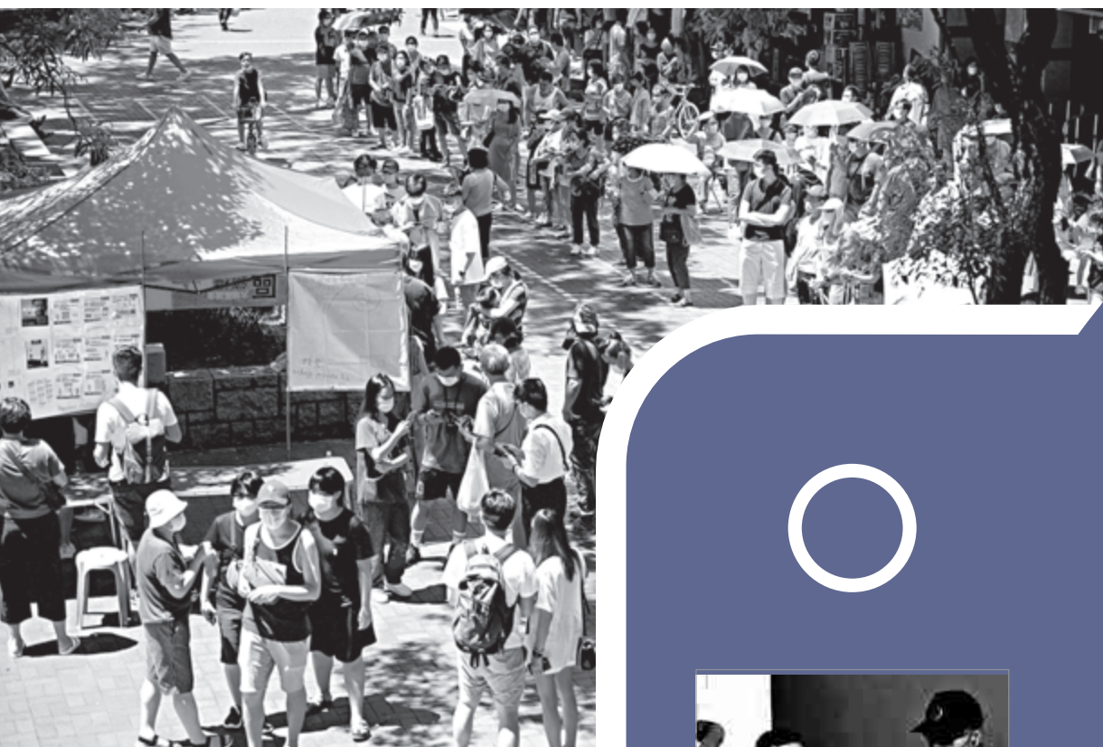
▲去年7月11日及12日舉行的所謂「初選」，攬炒派在全港設立超過250個票站，其中有超過160個是攬炒派區議員辦事處，公然違反限聚令。