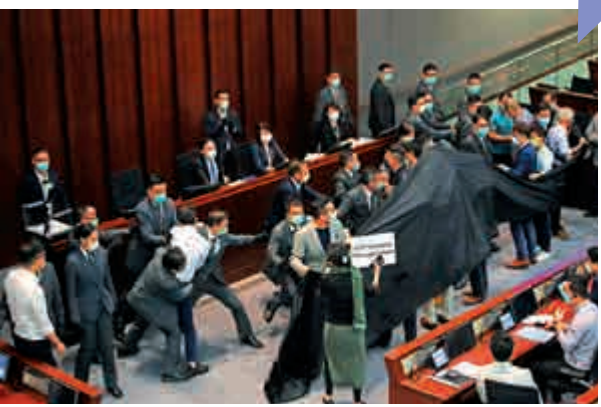
▲攬炒派過去多次在立法會發動「拉布」，阻撓議會正常進行。