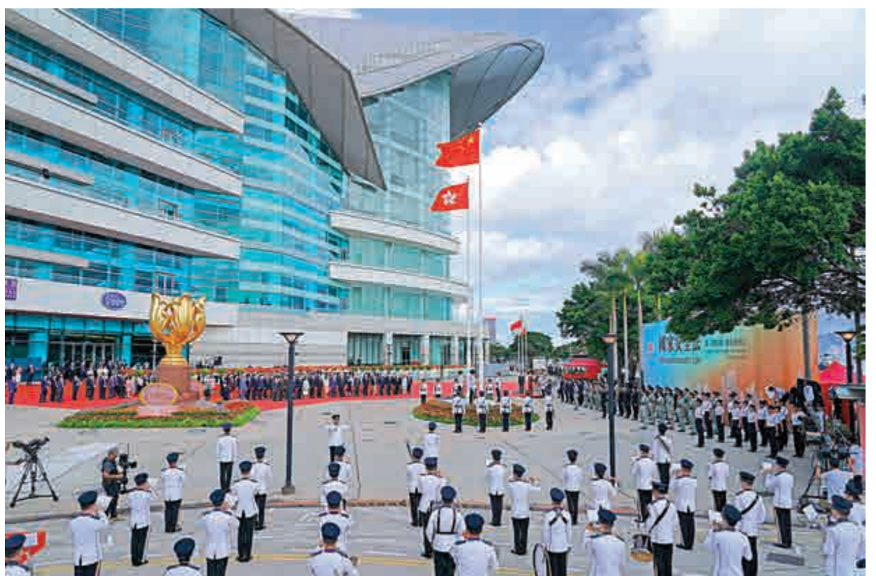
▲特區政府依法和盡責地履行維護國家安全的職責，無畏無懼。

蓬佩奧在聲明中稱，被捕的人只是實踐民主權利，並無干犯任何罪行，促請當局立即無條件釋放。美國支持香港人民，不會袖手旁觀，會考慮對任何相關的人士和實體實施制裁或其他限制，包括對香港駐美國的經濟貿易辦事處施加限制，以及對削弱香港民主的官員採取即時的行動云云。