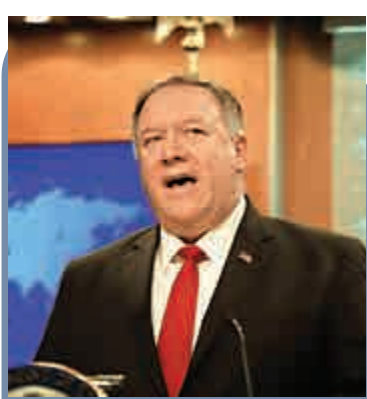
▲蓬佩奧發聲明，促特區政府無條件釋放有關人等，否則會對港實施制裁。