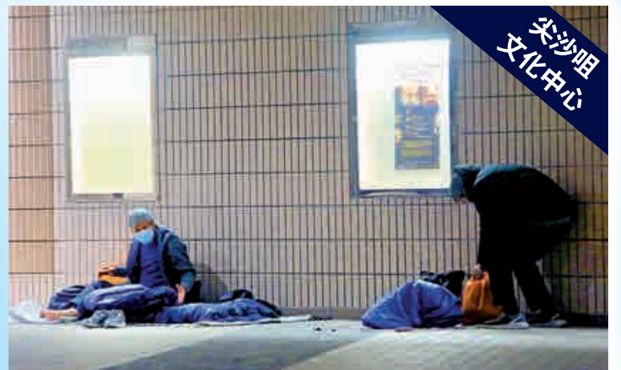
▲不少露宿者冒着寒冷天氣，在尖沙咀文化中心附近露宿。

天文台昨日發出寒冷天氣警告與霜凍警告，大帽山氣溫低至-2.5°C，大嶼山昂坪0.9°C，大老山1.1°C，山頂4°C。晚間市區也只得8°C低溫，街上行人不多，全都哆哆嗦嗦，身穿厚衣。