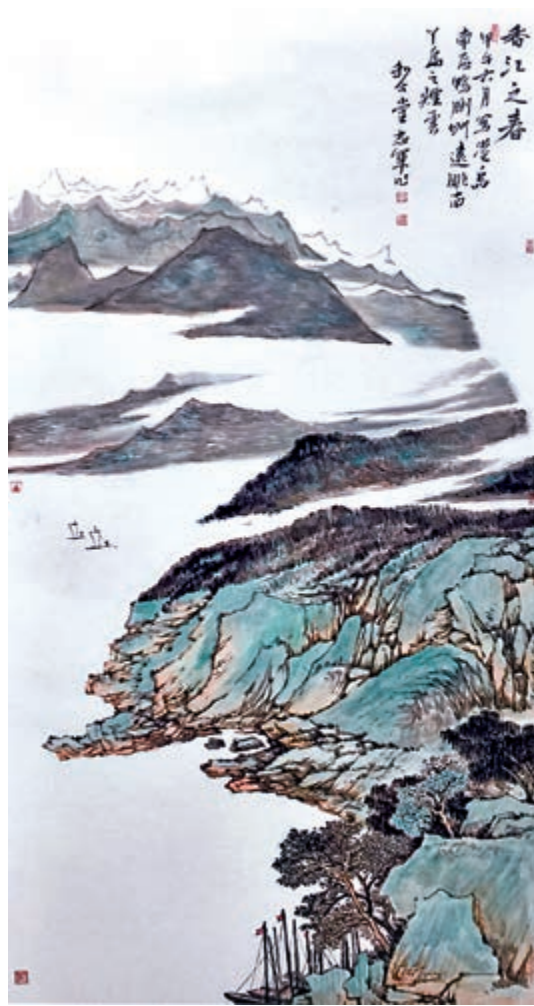
▲《香江之春》在靜謐中，帶給觀者親近自然的不一樣的香江。