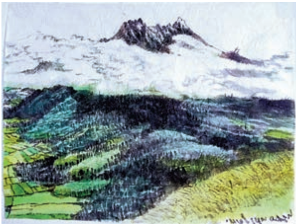
▲趙志軍二〇一四年作《天邊》。