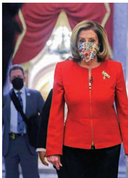
▲美國眾議院議長佩洛西8日抵達國會。