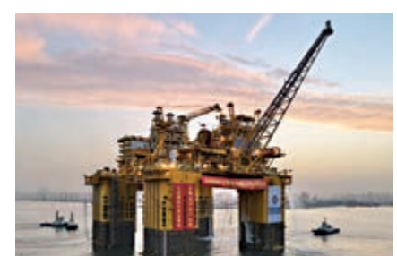
▲「深海一號」能源站在山東煙台正式交付啟航。網絡圖片

部組塊和船體兩部分組成，按照「30年不回塢檢修」的高質量設計標準建造，設計疲勞壽命達150年，可抵禦百年一遇的超強颱風。能源站搭載近200套關鍵油氣處理設備，同時在全球首創半潛