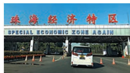
▲粵港私家車續免加簽通行港珠澳大橋。

珠海口岸。同時，凡獲准通行蓮塘口岸的粵港跨境非營運小汽車，從2月25日起免加簽通行港珠澳大橋珠海口岸。駕駛粵港非營運小汽車往返粵港兩地時，可選擇港珠澳大橋珠海口岸及此前獲准通行口岸中的任一口岸通行。