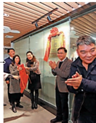
▲蓮塘社區港人服務中心揭牌。