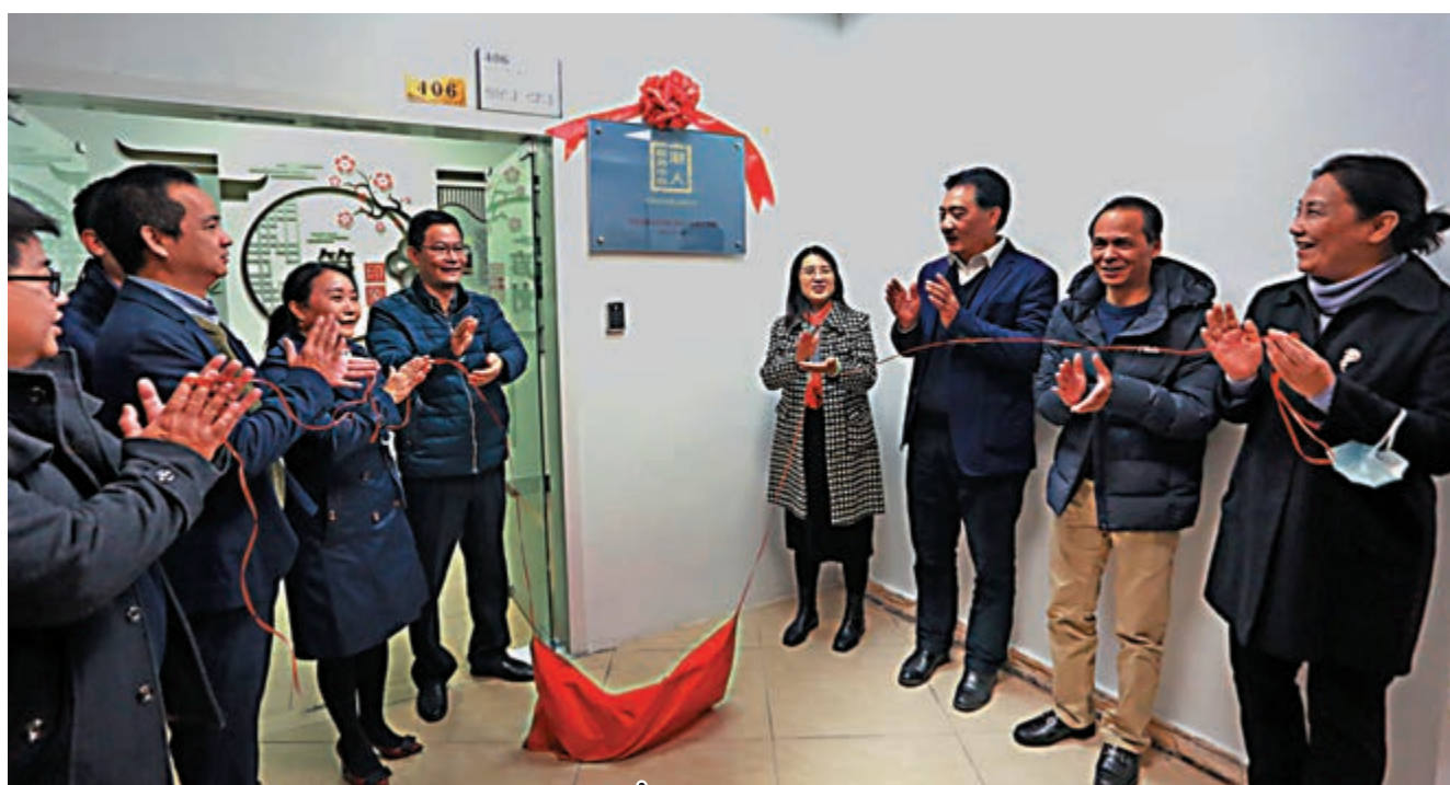
▲羅湖區日前增設了7個「港人服務中心」。圖為筍崗社區港人服務中心揭牌。

他表示，羅湖要聚焦「中央要求、灣區所向、港澳所需、羅湖所能」，有效對接香港發展規劃、全方位展開社會協同、持續深化青少年交流交往，不斷增強香港同胞對祖國的認同感。他強調，2021年羅湖的重點工作安排中包括全力推動深港口岸經濟帶取得關鍵性進展，上升為國家級深港合作新平台，高質量建設深港社會協同試驗區，打造2-3個品牌型港澳青年創新創業平台，服務粵港澳青年交流融合等。