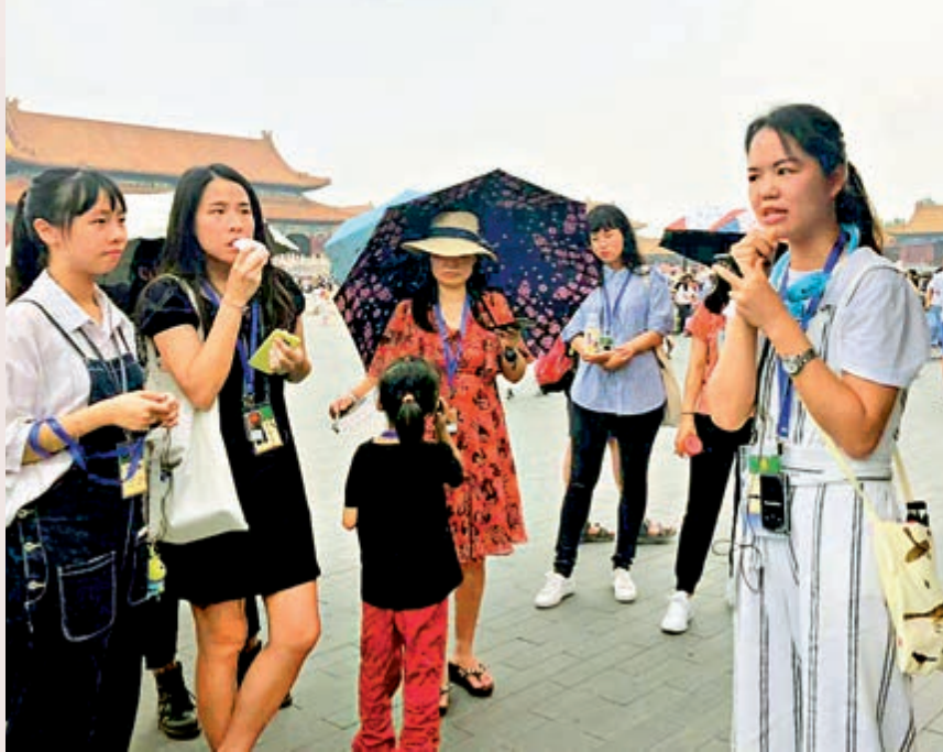
▲嘉恩（右）參與故宮博物院實習計劃期間，曾擔任導賞員為遊客講解。