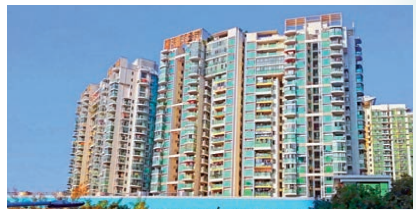
▲御花園是獨立花園。