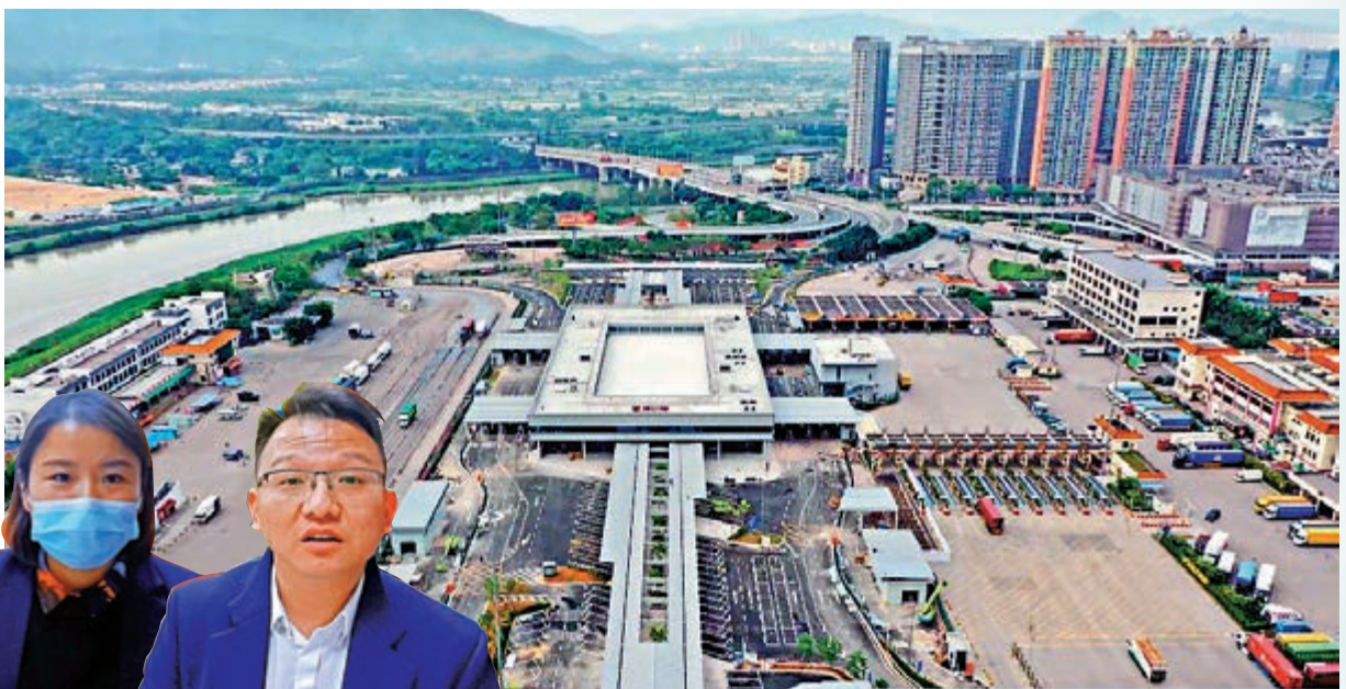
▲圖為皇崗口岸臨時旅檢樓航拍圖。