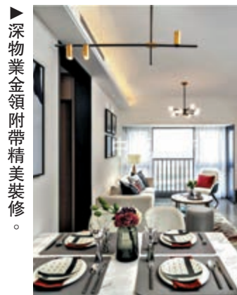
▲深物業金領附帶精美裝修。

他表示，深港一號東南向可以看到香港，通風採光佳，樓層高無遮擋，視野開闊，戶型方正，格局合理，住家舒適，物業管理嚴格。該樓盤地理位置十分優越，步行5分鐘可以走到7號線地鐵皇崗口岸站，該口岸是24小時通關。深港一號周邊有皇崗口岸公交站，交通便捷，並且在皇御苑大社區內，共享健身、餐飲、購物等成熟配套設施，生活便利，未來升值空間不錯。