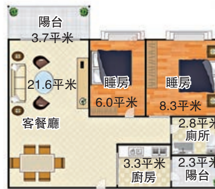
皇御苑二期兩房一廳戶型圖

司。2014年他在皇御苑二期購買的86平米三房，價格為160萬，剛開始先出租，然後自住，現在他房產的價格已上漲近四倍，準備擬750萬出售，目前正在商洽。