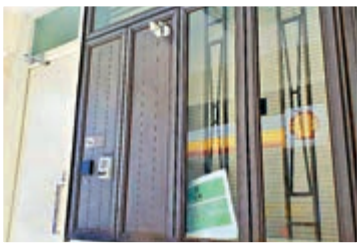
▲神秘辦事處沒有招牌，門窗緊閉，窗簾拉上，大門需按上密碼才能進入，非常神秘。

不論是Jack Clancey或是Joseph Clancey，關尚義的政治地位非比尋常。2012年他以美國民主黨香港支部前主席的名義，發表一封致時任美國副總統拜登的公開聲明，聲明披露拜登一直去信要求關尚義支持時任總統奧巴馬，關尚義在聲明中解釋不再言撐民主黨總統，拒絕支持奧巴馬的原因，事件反映關尚義在美國民主黨的地位有相當分量。至截稿前，關尚義未有就他曾任美國民主黨香港支部主席、美國民主黨與香港民主黨的聯繫及他的兩個姓名回覆《大公報》的查詢。