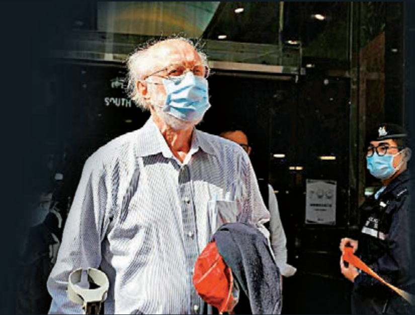
▲關尚義與即將上任的美國總統拜登有交情，亦曾以不同名字活躍香港政壇，政治背景殊不簡單。