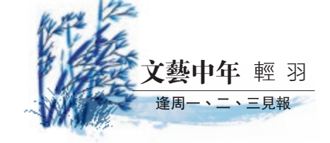
文藝中年 輕羽 逢周一、二、三見報