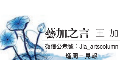
藝加之言 王加 微信公眾號：Jia_artscolumn 逢周三見報