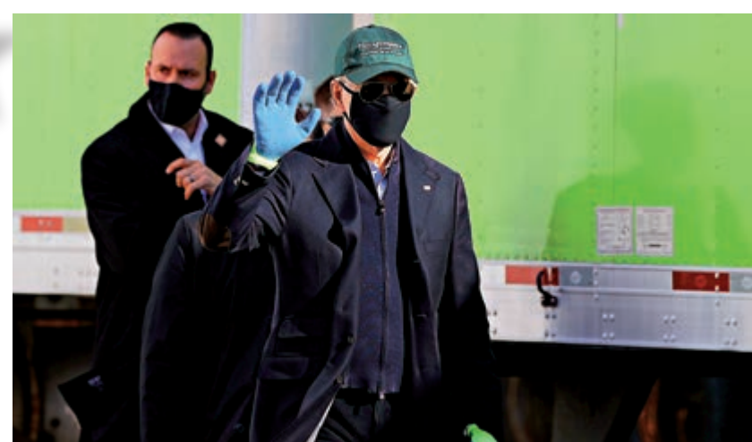
▲拜登18日前往費城做義工。

自去年3月中旬起，美國對在過去14天內曾在歐洲神根區、英國與愛爾蘭停留的非美國公民實施入境限制，並從5月起對巴西實施相關旅行限制。