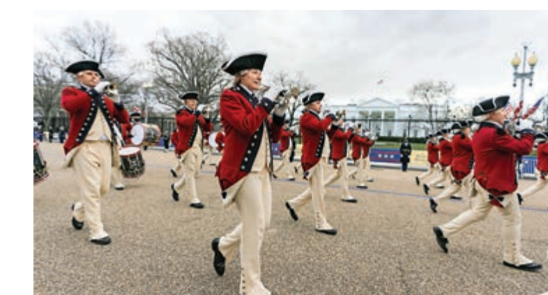
▲美國陸軍軍樂隊18日在國會外綵排。

自特朗普支持者1月6日暴力闖入國會，並造成5人死亡後，華盛頓就進入高度戒備狀態。除防武裝示威，聯邦調查局(FBI)近日正加緊對所有進駐華府的士兵進行背景審查，以防出現「內部襲擊」。美媒19日報道，FBI私下向執法部門發出警告，指陰謀論組織「匿名者Q」(QAnon)的支持者和「孤狼型」激進分子，曾在網絡上討論假扮成國民警衛隊士兵混入典禮，並專門下載華府敏感地區的地圖研究如何利用各種設施干擾安保。另有情報信息顯示，有恐襲計劃點名刺殺兩黨議員，不少出席者已預先準備好防彈背心。 今次就職典禮作為「國家安全的特殊事件」，將有2.5萬國民警衛隊士兵進駐華府，被傳媒稱為「華盛頓歷史上最大規模的安保駐軍」。特工處已在華盛頓市中心劃定軍事化區域，包括白宮、林肯紀念堂、國家廣場和