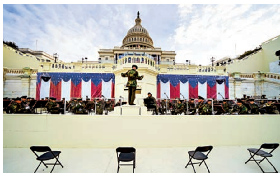
▲軍樂隊18日在國會綵排時，使用透明隔板、座位保持一定距離防疫。

今屆就職典禮定於美東時間1月20日早上11時半開場，即本港時間21日凌晨12時半舉行。屆時拜登將在美國最高法院大法官羅伯茨的見證下，宣誓就任美國第46任總統，並發表主題為「美國團結」的演說。雖然總統特朗普拒出席，但副總統彭斯將參加典禮，拜登亦將與三位美國前總統奧巴馬、小布希和克林頓一同在無名戰士墓碑前獻花。 但與往年不同，今年儀式規模極其有限，僅1000名受國會人員邀請的人士可入場，過去這類儀式會發放20萬張觀禮「入場券」，許多活動也改為網絡直播。公眾可在家通過電視直播欣賞「虛擬遊行」，以免人群大規模聚集。