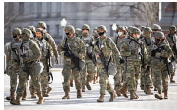
▲國民警衛隊士兵18日攜槍巡視國會東廣場。