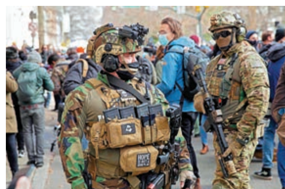
▲特朗普的支持者18日在弗吉尼亞州議會外持槍示威。