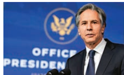
▲美國候任國務卿布林肯。

候任副總統哈里斯18日提交參議員辭呈給加州州長紐森，紐森已指派加州州務卿帕迪拉頂替哈里斯的參議員席位，但帕迪拉何時能夠宣誓就職仍未可知。