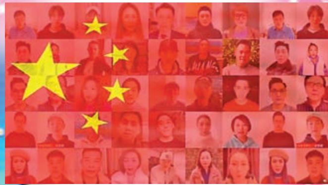
▲多位港星拍片為河北抗疫打氣。