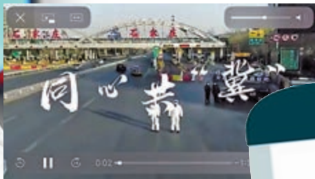
▲「同心共『冀』」，聲援河北」短片成為微博話題熱門榜單。