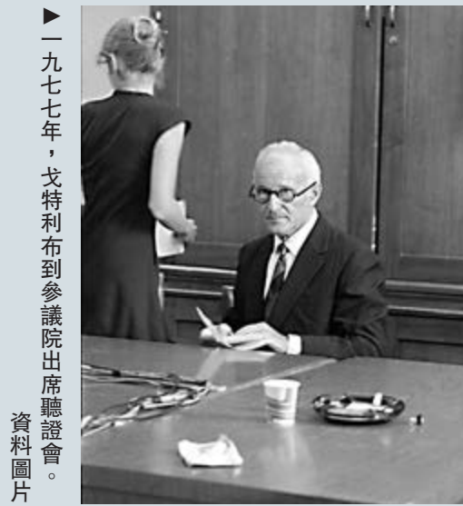
一九七七年，戈特利布到參議院出席聽證會。資料圖片

1956年，德特里克營地更名德特里克堡。20世紀60年代初，戈特利布的實驗以失敗告終，但他仍在德特里克堡為CIA工作。