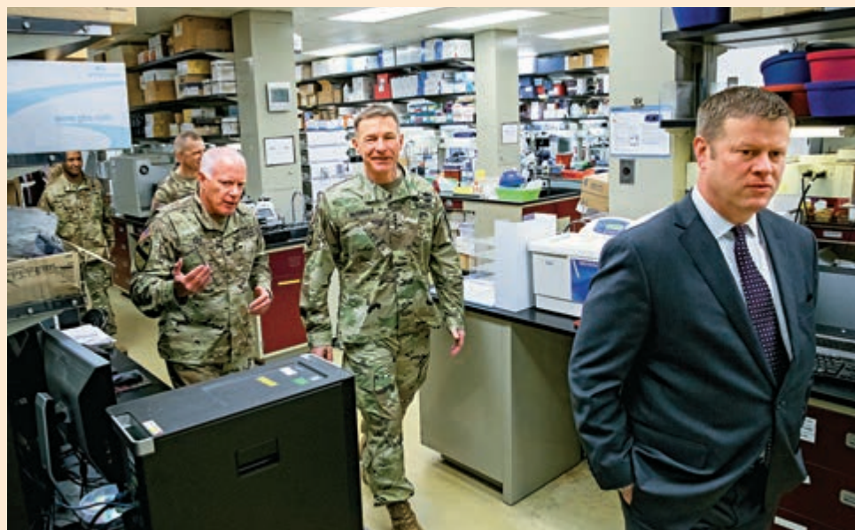
二〇二〇年三月，美軍高官在德特里克堡參觀。

距離德特里克堡僅一小時車程的弗吉尼亞州「綠色春天」退休社區，亦在實驗室關閉前後出