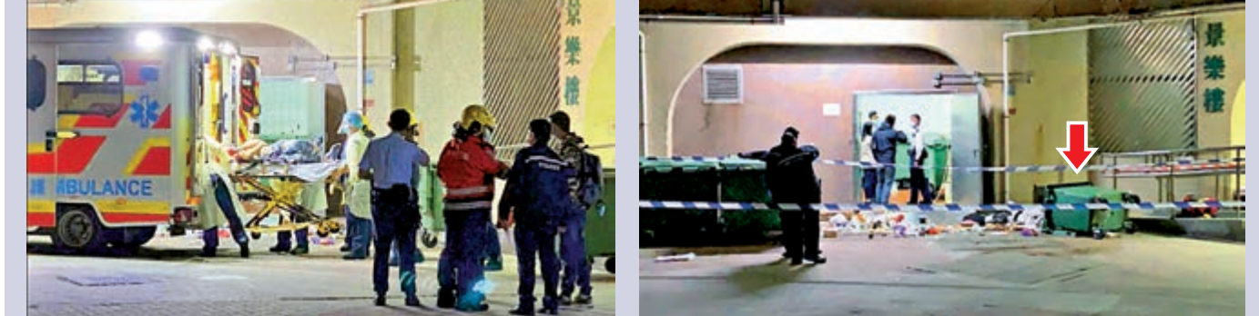
▲山景邨景樂樓清潔工失足飛墮垃圾槽內（右圖箭嘴所示），被救出後送院，惜經搶救後不治。 網上圖片