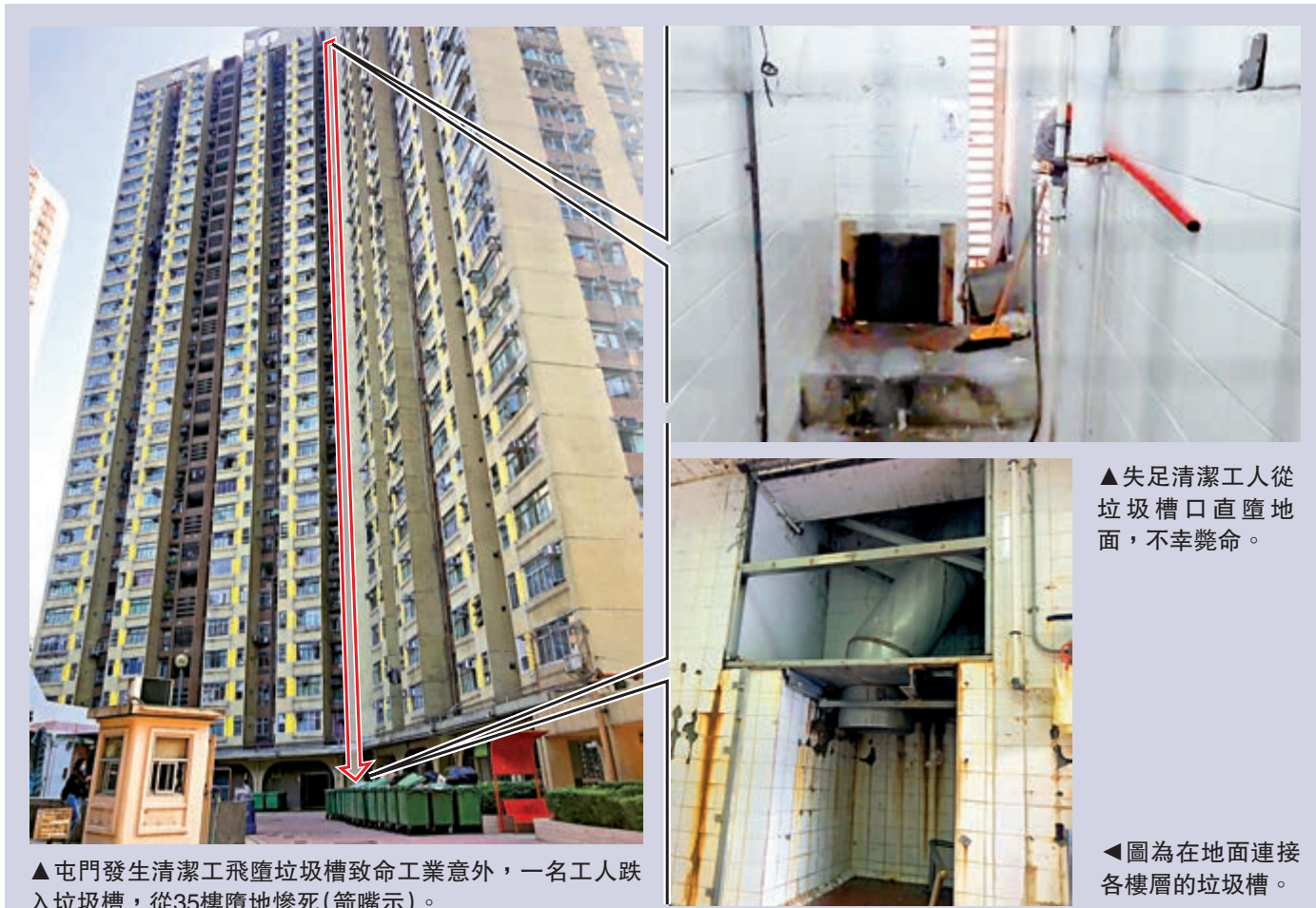
▲屯門發生清潔工飛墮垃圾槽致命工業意外，一名工人跌入垃圾槽，從35樓墮地慘死（箭嘴示）。