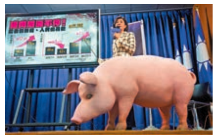
▲國民黨21日舉行記者會，抨擊民進黨當局開放含瘦肉精美國豬肉進口，造成島內豬肉頻漲價。

灣！」「所以說吃萊豬也不是當務之急，民進黨在急什麼？」「吞萊沒有談 吞萊沒得談 叫你吞你就吞再吵就是白吞」。