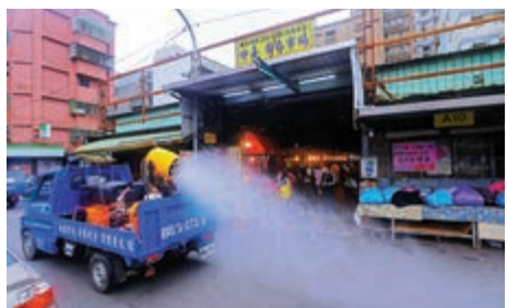
▲23日，桃園市出動防疫消毒車對確診者曾涉足的市場進行消毒。

【大公報訊】據中社社報：台灣桃園醫院新冠肺炎群聚感染疫情持續擴大，繼22日首見住院病人及其家屬確診後，該病人另一同住家屬23日亦確診。目前桃園醫院群聚感染隔離人數攀升至967人，為疫情至今最大隔離規模。