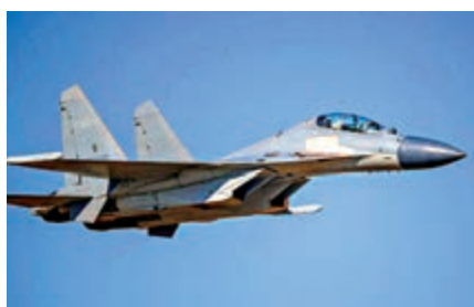
▲台防務部門1月23日發布的解放軍殲-16戰機資料圖片。台防務部門

【大公報訊】據觀察者網報道：台灣防務部門網站1月23日發布消息稱，13架次解放軍軍機進入台灣「西南空域」，這也是今年以來單日最大規模。