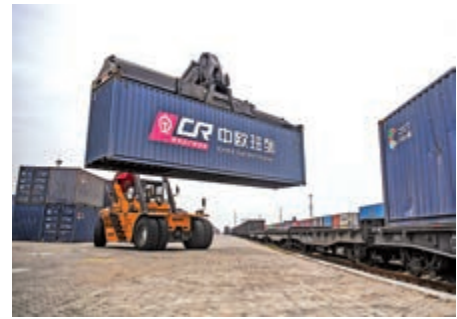
▲1月16日，在廣西欽州港東站，吊車在裝運中歐班列貨物。

第四，攜手應對全球性挑戰，共同締造人類美好未來。類似新冠肺炎疫情的突發公共衛生事件絕不會是最後一次，全球公共衛生治理亟待加強。加大應對氣候變