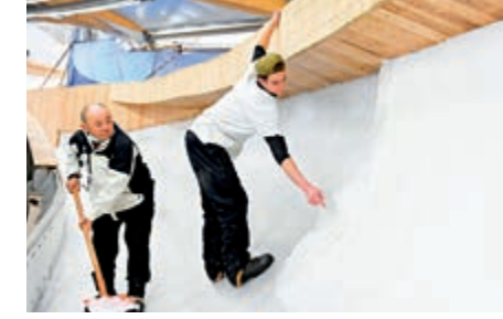
▲去年10月，中法製冰師在北京冬奧會延慶賽區國家雪車雪橇中心的賽道上進行施工作業。

習近平強調，中國率先控制住國內疫情並實現經濟復甦，為北京冬奧會順利舉辦創造了有利條件。我們嚴格落實防控措施，克服疫情影響，積極推動各項籌辦工作穩步向前。目前，北京冬奧會場館和基礎設施建設取得階段性成果，賽事組織工作有序開展，賽會服務保障工作全面推進，宣傳推廣持續升溫，國際交流合作深入開展，可持續發展和遺產工作成效顯著。我們以籌辦北京冬奧會為契機，推動冰雪運動普及發展。相信在各國各方大力支持下，中方