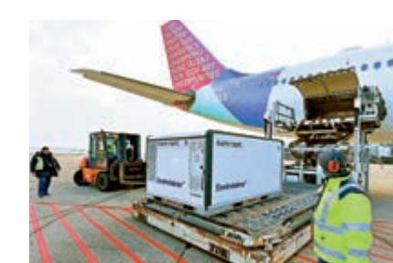
▲16日，塞爾維亞的工作人員卸載中國國藥集團生產的新冠疫苗。

利共贏的開放戰略。中國將着力推動規則、規制、管理、標準等制度型開放，持續打造市場化、法治化、國際化營商環境，發揮超大市場優勢和內需潛力，為各國合作提供更多機遇，為世界經濟復甦和增長注入更多動力。中國將繼續促進可持續發展。加強生態文明建設，確保實現2030年前