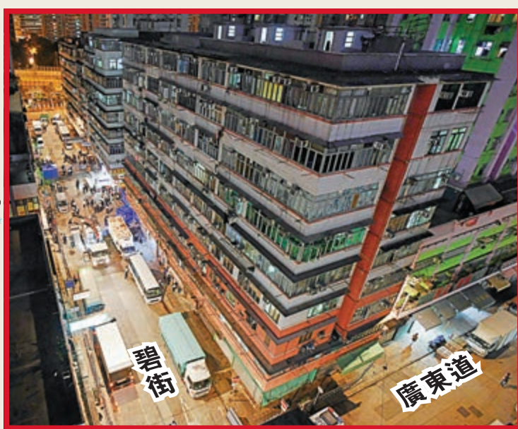
▲政府昨晚七時突然宣布將油麻地碧街9-27號和東安街3號順豐大廈，劃為指定「受限區域」。