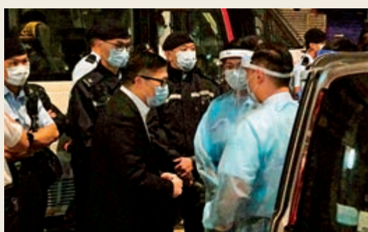
▲警務處處長鄧炳強昨晚到現場，為當值警員打氣，並與檢測人員傾談。