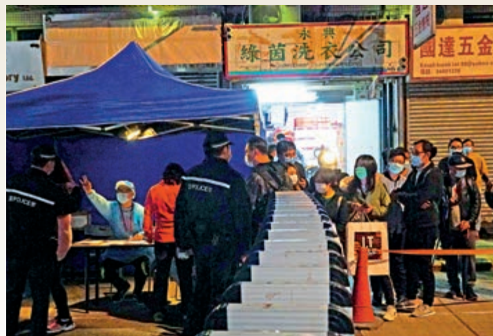
▲政府設立臨時採樣站，居民必須在午夜前接受檢測。