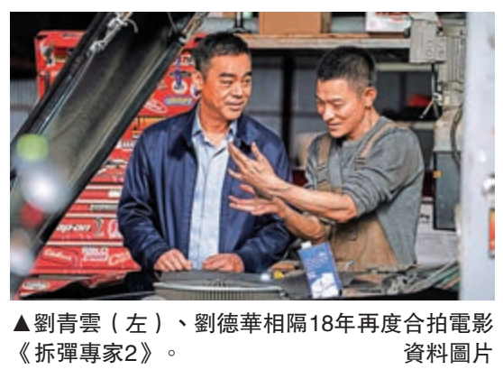
劉德華出道40年一直帥氣十足。