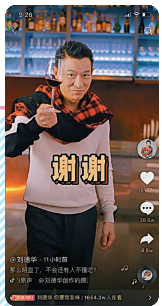
▲劉德華開通抖音，已透過抖音賬號發布3條短視頻。目前點讚合計超過5000萬。