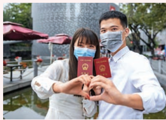
一對新人在深圳市南山區民政局婚姻登記處前合影。