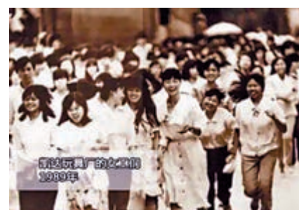
▲80年代凱達玩具廠的女工們，是最早的一批深圳女孩。網絡圖片