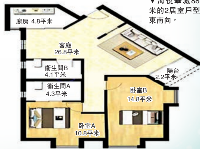
▼海悅華城88平米的2居室戶型，東南向。