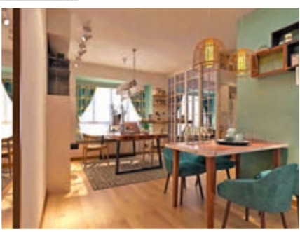
▲港城華庭缺點是幾乎所有戶型都有不方正的地方。