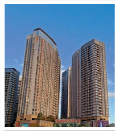
▲金地名津的投資首選還是商品房。

對於首付有限的港人購房者來說，可以選擇小戶型的商品房，也可以選擇單價稍微便宜的公寓，但由於公寓首付要五成且不好脫手，建議港人首選以商品房為主，畢竟商品房在如今的深圳市場更受歡迎、成交更活躍，想換房時也可以更快脫手，且首付只需三成。