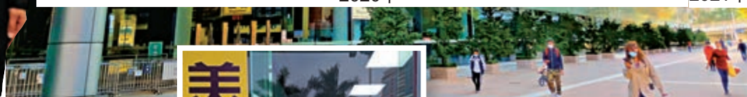
▲2007年開通的福田口岸。