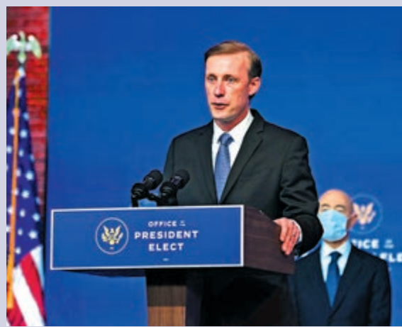
▲美國國家安全事務助理蘇利文去年11月24日在拜登公布國安團隊人選後講話。

【大公報訊】綜合路透社、美國之音、彭博社報道：美國拜登政府上台之後，是否取消前任特朗普政府留下的關稅措施，引發外界關注。白宮29日表示，拜登政府將重新評估特朗普實施的所有國家安全措施，包括2020年1月簽署的中美第一階段貿易協議，並將藉此重新界定與中國的關係。同日，美國國家安全事務助理蘇利文出席論壇時，指美將對中國「採取行動」，這是繼前任國務卿布林肯之後，又一名對華展示強硬姿態的重要官員。