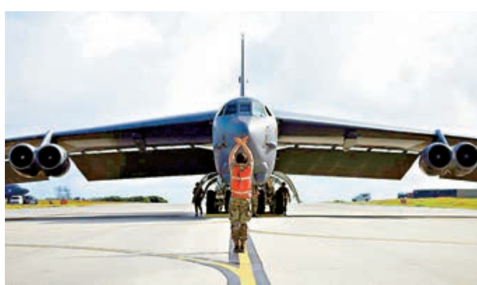
▲美軍一架B-52H轟炸機26日抵達關島安德森空軍基地。

四架B-52H轟炸機隸屬路易西安那州巴斯代爾空軍基地的第96轟炸中隊，自25日至28日先後在巴斯代爾空軍基地出發，飛往關島安德森空軍基地。其中編號為PEPSI52的轟炸機途中更繞行中國南海地區。軍方聲稱，這是戰略威懾任務，以轟炸機特遣隊形式部署。此舉有助於與盟友合