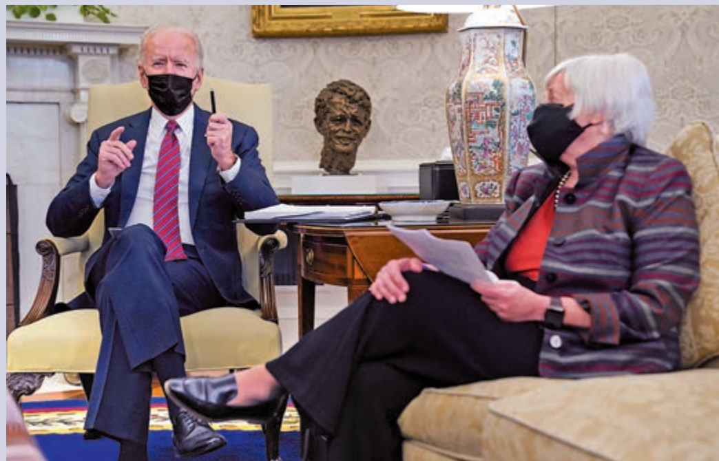
▶美國總統拜登29日在白宮會見財政部長耶倫。

白宮新聞發言人普薩基29日出席記者會時，被問到拜登是否視中美第一階段貿易協議仍有效。她回應指，新政府正審查上屆政府制定的所有政策，包括貿易協在內。因為都與國家安全有關，所以她不會預設所有政策都會延續。