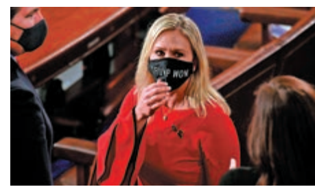
▲眾議員格林3日就職時戴着寫有「特朗普勝選」的口罩。

格林為出名的「Q粉」議員，宣揚過種族主義、反猶太及反穆斯林言論。她於2019年發起請願要求以叛國罪彈劾並處死佩洛西，更支持「絞死」前總統