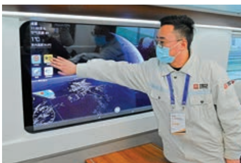
▲中國首列基於5G車通信全自動駕駛的列車在四川成都下線。

四川將建設成都國家新一代人工智能創新發展試驗區，創建國家工業互聯網一體化發展示範區，推進數字農業試點建設，探索建立6G通信試驗場。